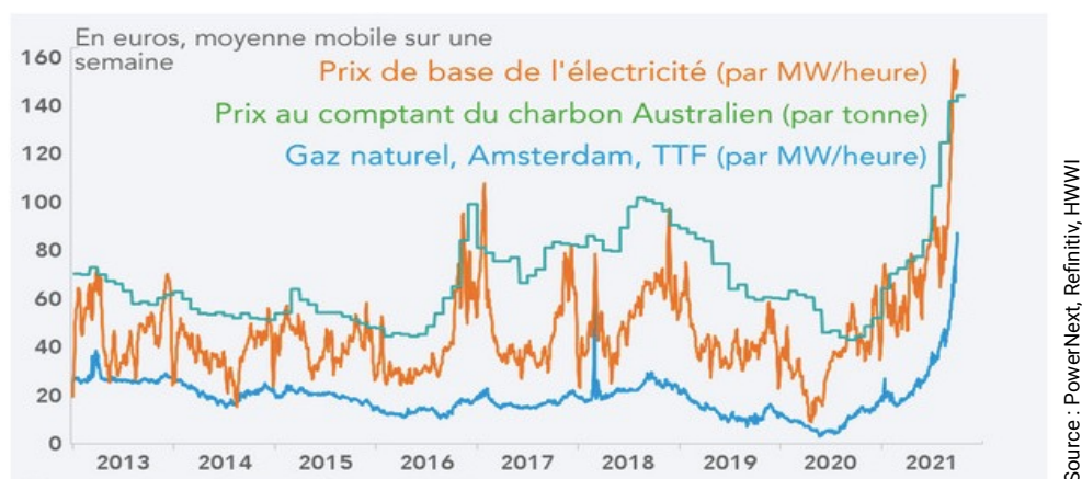
Figure 1 : Prix de l'électricité, du gaz naturel et du charbon

Le secteur du transport et de la logistique a révélé sa centralité, mais aussi sa grande vulnérabilité face à un événement imprévisible, en l'occurrence un virus. La théorie du cygne noir 7 , popularisée par l'auteur à succès Nassim Nicolas Taleb, a trouvé dans cette crise un cas d'application pratique.